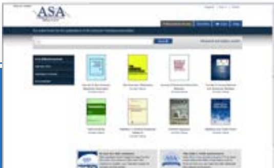
ポータルサイト フロントページ

Taylor & Francisは、自社の革新的な発想に誇りを持ち、努力を惜しみません。その一例として、American Statistics Associationのような学術団体向け、専用のポータルサイトの作成を行っています。Taylor & Francis Online上に置くことで、各学術団体とTaylor & Francisのウェブサイトとを機能的にブランディングさせています。