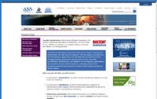
メンバー専用ページ

ASA用に作成されたポータル・サイトでは、メンバーや購読者がTaylor & Francisより出版されたASA関連ジャーナルにアクセスでき、論文単位でのメトリクス、および彼らのジャーナルに限定した検索機能を提供しています。